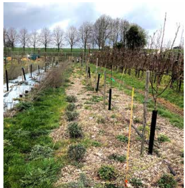
Voedselbos Waalgaard is een voormalige perenboomgaard.

Voedselboscoöperatie Arbres kocht in 2020 een gangbare perenboomgaard van 2,7 hectare in Weurt, met bomen van 20 jaar oud. Dit wordt Voedselbosgaard de Waalgaard.